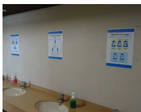
水場の掲示も一新しました