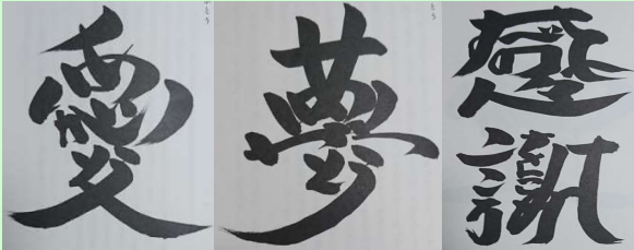
ありがとう ありがとう すべての人へ こころをこめて